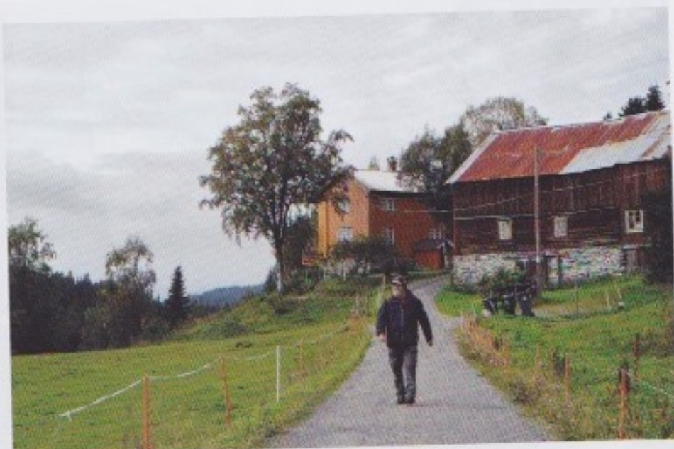
▲ Onderweg naar Trondheim