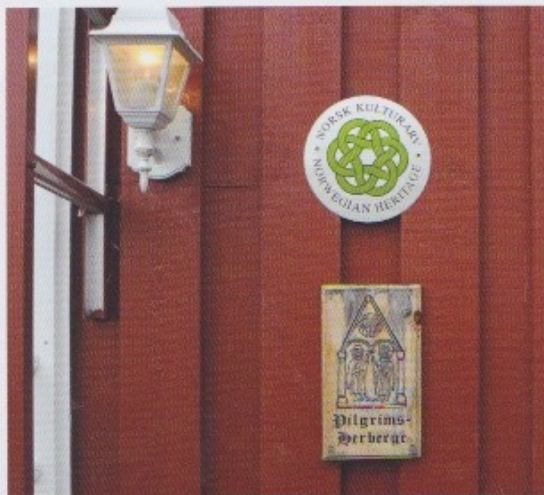
▲ Aan het karakteristieke logo herken je het Olavspad en de herbergen.